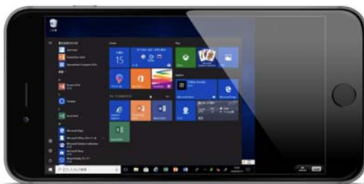
デスクトップ画面